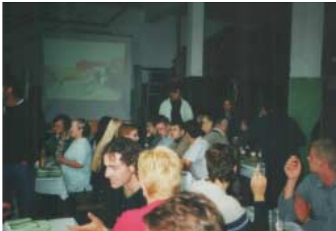
01.10.2000: Dorfer Kirtag mit „1. Dorfer Erlebnisfest“