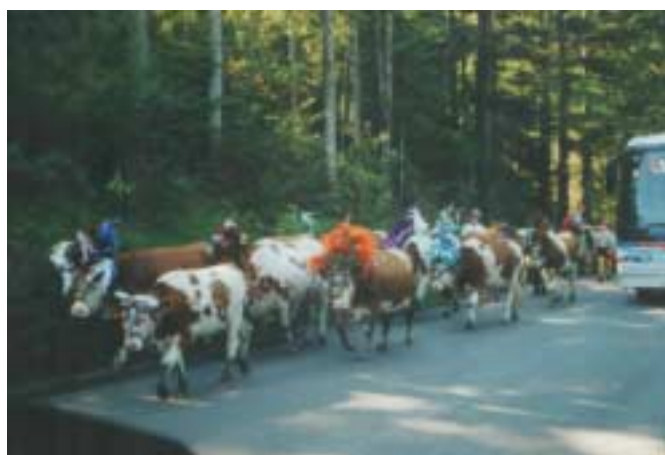
23./24.09.2000: Feuerwehrausflug – Almabtrieb