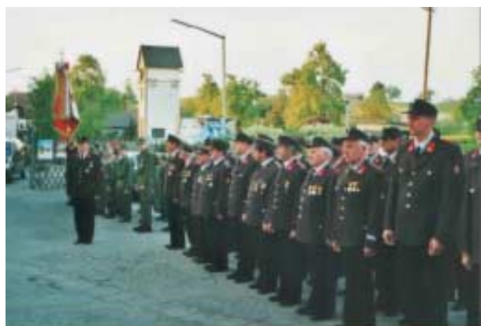
05.05.2000: Feier zu Ehren des hl. Florians