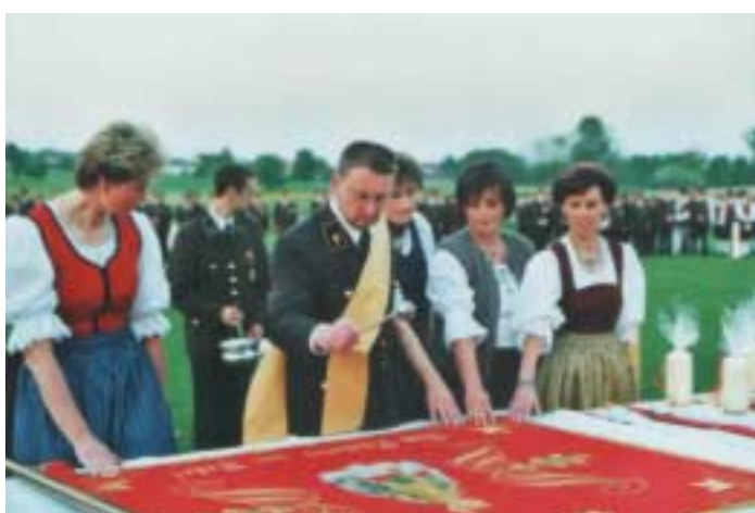
06.05.2000: Segnung der Fahne