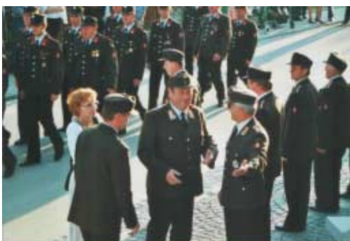
06.05.2000: Empfang der Gastfeuerwehren und Ehrengäste