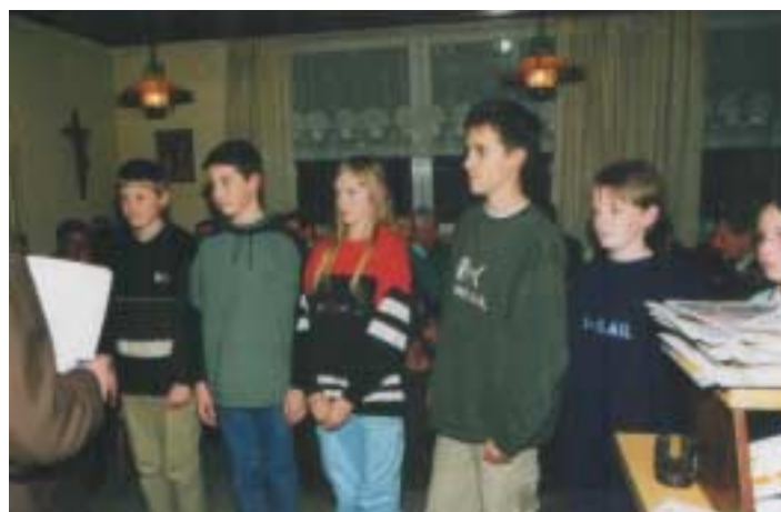
24.03.2000: Vollversammlung – Angelobung unserer JFM