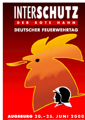
22.06.2000: Besuch der Interschutzmesse („Roter Hahn“) in Augsburg