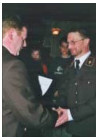
24.03.2000: Vollversammlung – Angelobung unseres FKUR