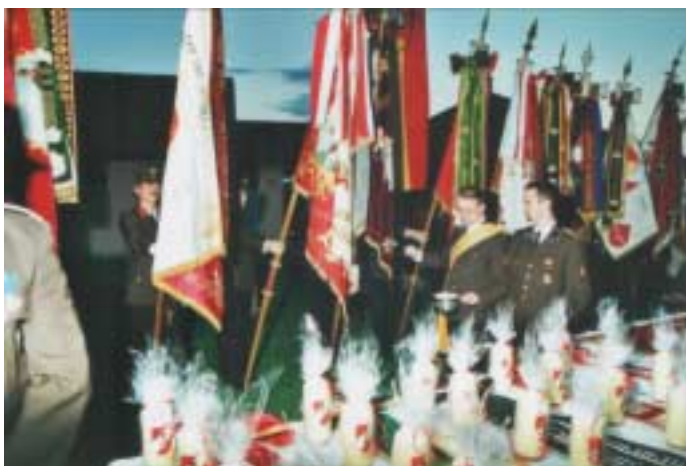
06.05.2000: Segnung der restlichen, anwesenden Fahnen