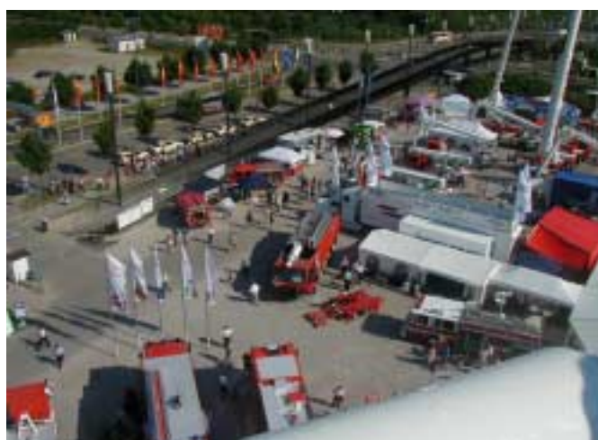
22.06.2000: Interschutz (Augsburg)