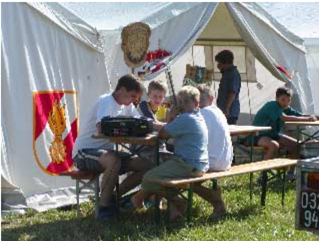
12. bis 15.07.2001: Jugendlager in Weibern