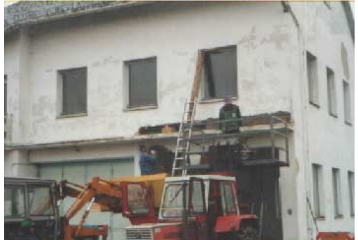
November 2001: Zeughaus-Umbauarbeiten