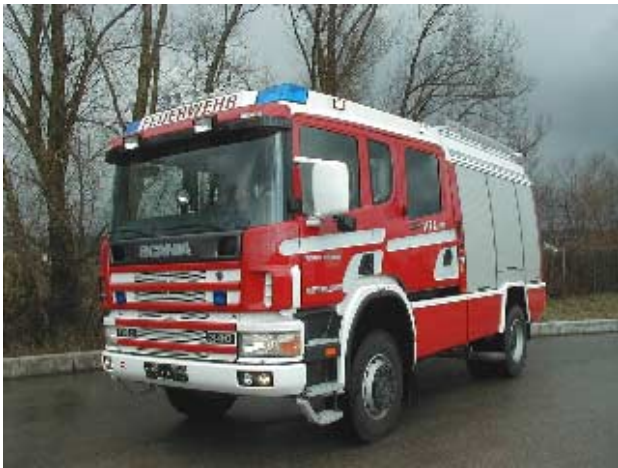
16.03.2001: Unser künftiges TLF-A 2000!