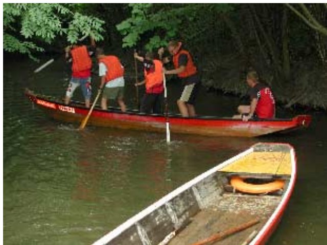
12. bis 15.07.2001: Jugendlager in Weibern