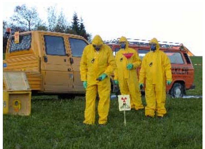
03.11.2001: Strahlenschutzübung in Haag am Hausruck