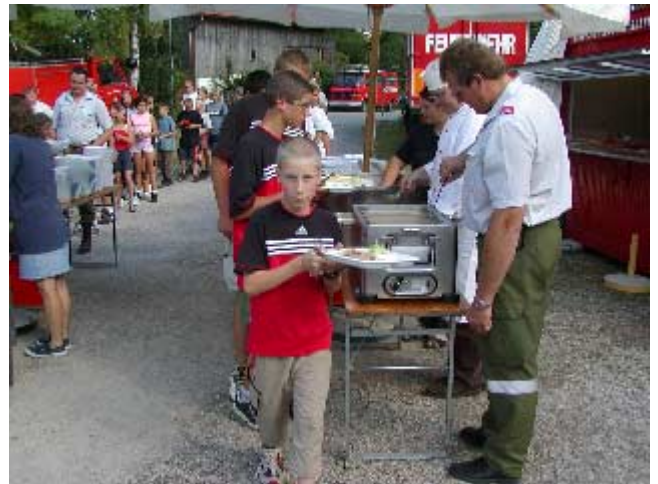
12. bis 15.07.2001: Jugendlager in Weibern