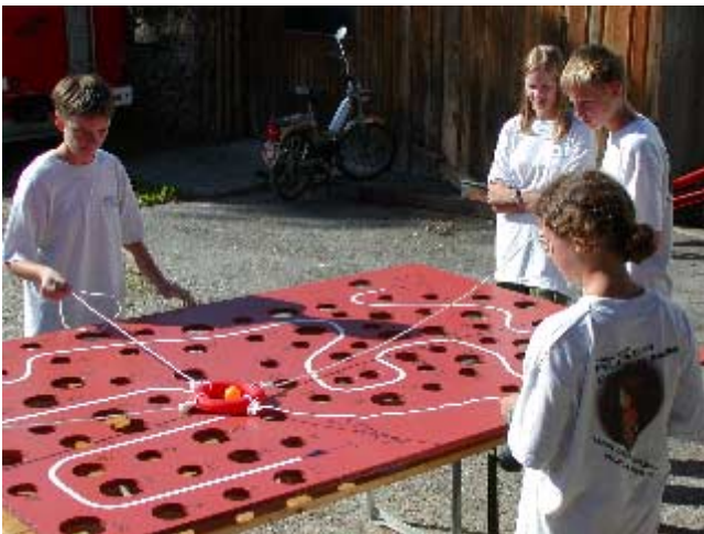
12. bis 15.07.2001: Jugendlager in Weibern