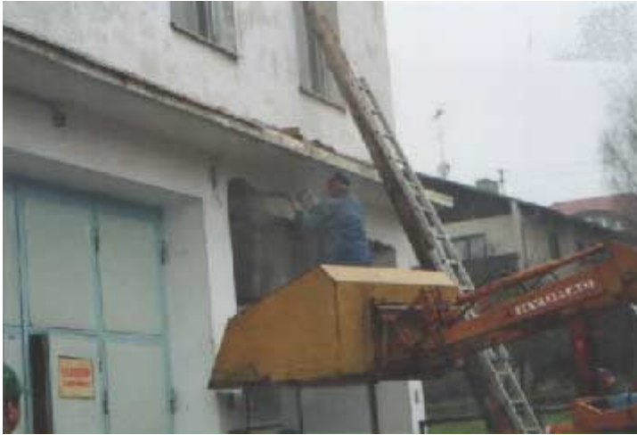
November 2001: Zeughaus-Umbauarbeiten