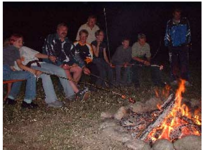
12. bis 15.07.2001: Jugendlager in Weibern