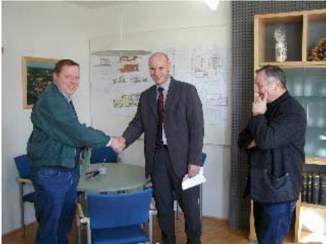
16.03.2001: Unterzeichnung des Kaufvertrages für das künftige TLF-A 2000