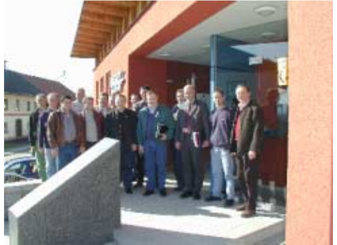
16.03.2001: Abschließendes Gruppenfoto nach der Vertragsunterzeichnung