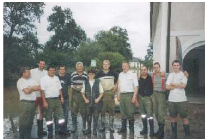
10.08.2002: Assistenzeinsatz in Haid bei Mauthausen