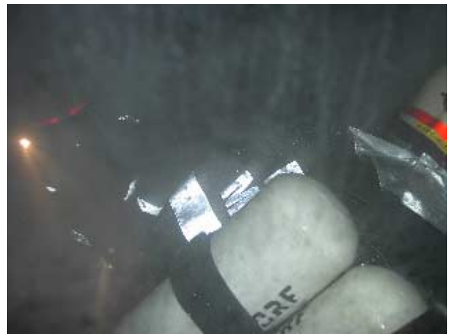
19.10.2002: Hot-Container-Training (Das Vorrücken des AS-Trupps)