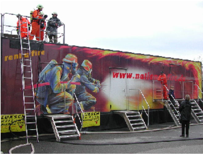
19.10.2002: Hot-Container-Training (Der Container)