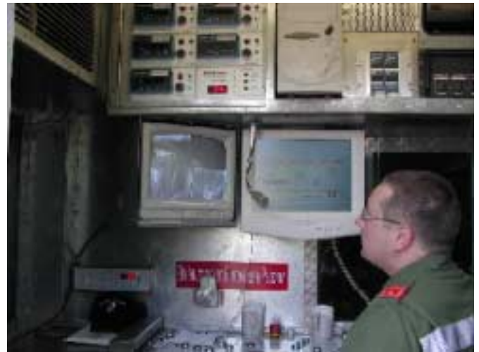
19.10.2002: Hot-Container-Training (Der Überwachungsraum)