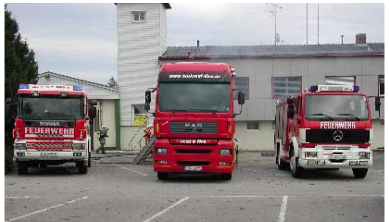
19.10.2002: Hot-Container-Training (Fahrzeuggegenüberstellung)