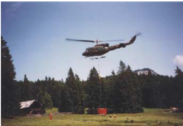
11. bis 14.07.2002: Jugendlager in Bad Goisern