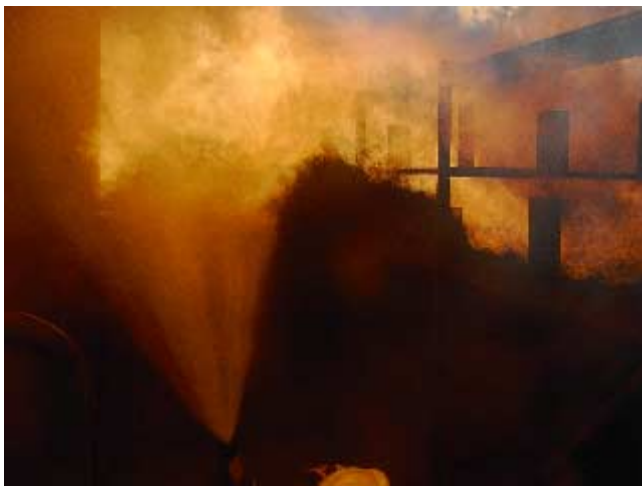
19.10.2002: Hot-Container-Training (Der Löscheinsatz)