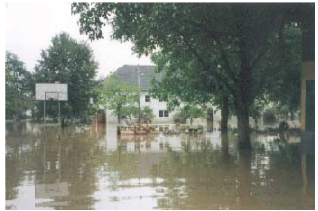
10.08.2002: Assistenzeinsatz in Haid bei Mauthausen