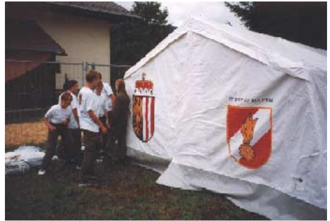
11. bis 14.07.2002: Jugendlager in Bad Goisern