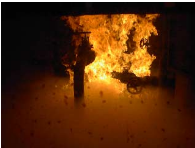
19.10.2002: Hot-Container-Training (Das "Innenleben")