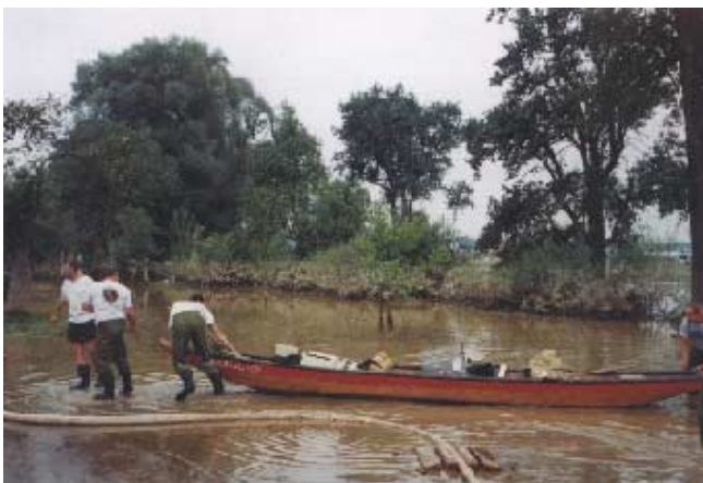
10.08.2002: Assistenzeinsatz in Haid bei Mauthausen