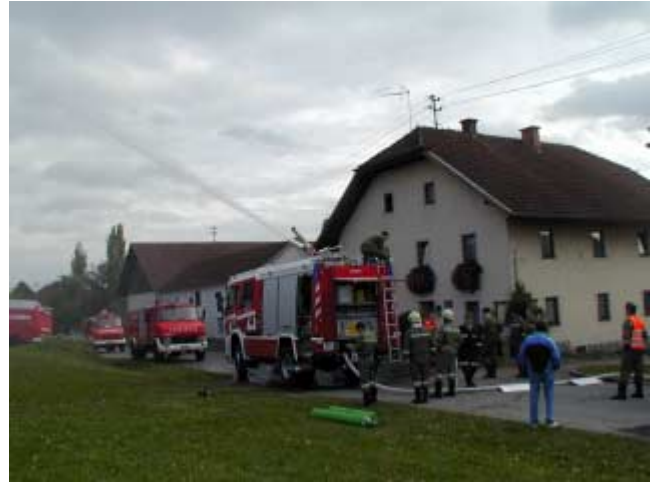
11.10.2003: Herbstübung in Jebing