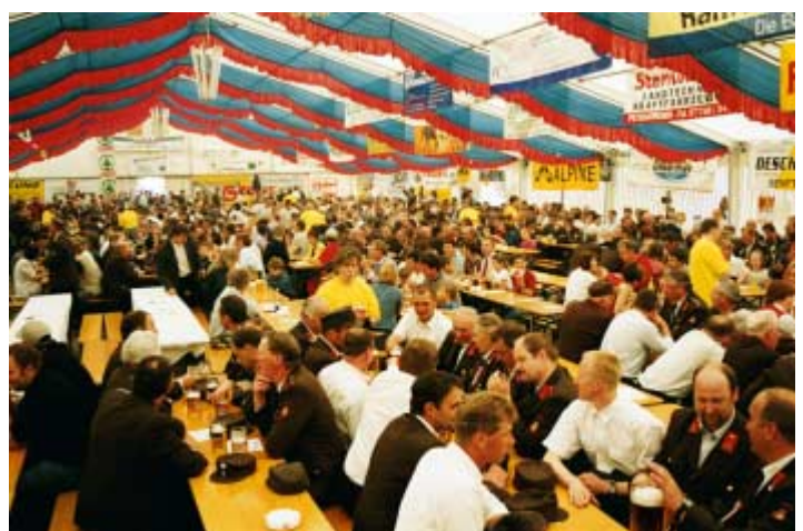
02.bis 04.05.2003: Zeltfest mit TLF-A 2000 Segnung in Dorf an der Pram