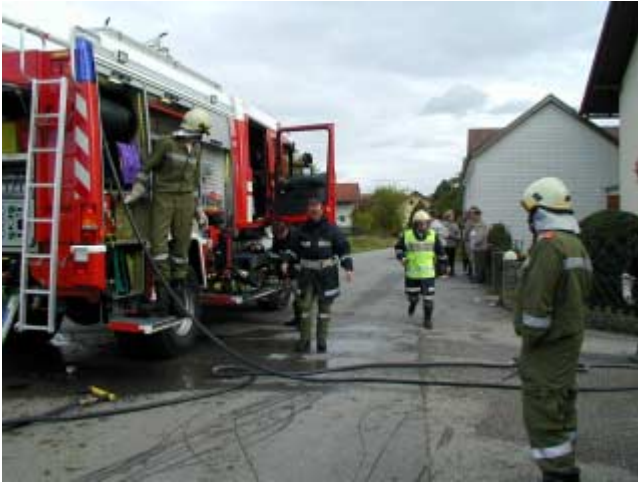
11.10.2003: Herbstübung in Jebing