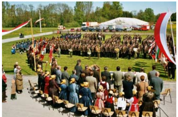
02.bis 04.05.2003: Zeltfest mit TLF-A 2000 Segnung in Dorf an der Pram