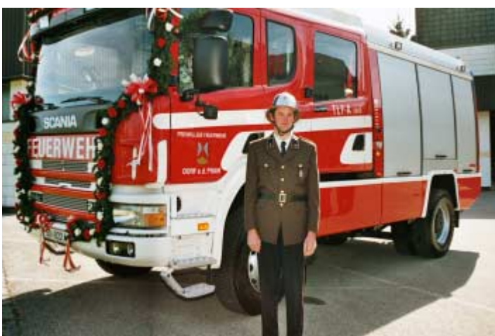
02.bis 04.05.2003: Zeltfest mit TLF-A 2000 Segnung in Dorf an der Pram