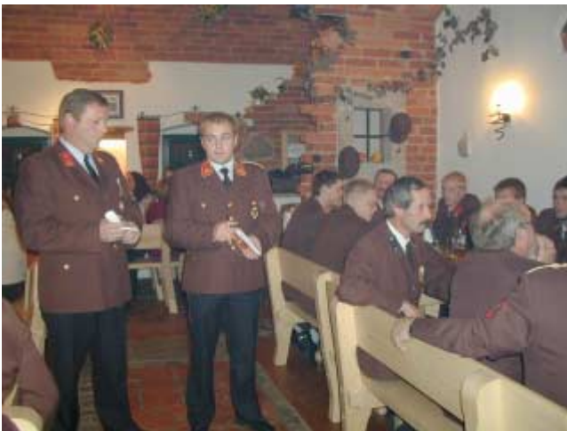
31.10.2003: Treffen der beiden Feuerwehren Dorf und Hinterndobl mit Überreichung der Hochwasserverdienstmedaillen