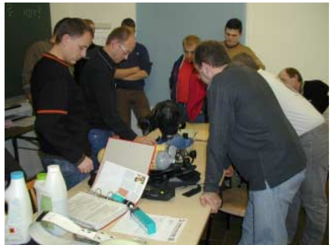
04.11.2003: Atemschutzschulung im Feuerwehrhaus