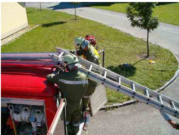
18.09.2004: Abschlussübung im Zuge der feuerwehrinternen Truppmann-Ausbildung