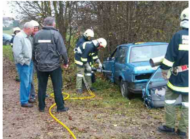
30.10.2004: Herbstübung in Pimingsdorf