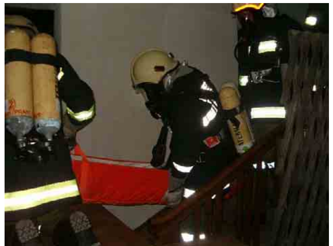
14.05.2005: Atemschutzübung im Schloss Zell an der Pram.