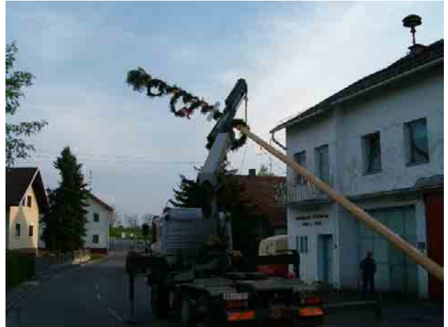
30.04.2004: Aufstellen des Maibaums