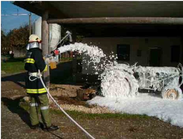
23.10.2004: Herbstübung in Breitenried