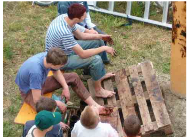
16.05.2005: Die Kraxler.