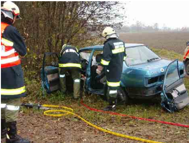
30.10.2004: Herbstübung in Pimingsdorf