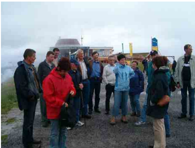
21. bis 22.08.2004: Feuerwehrausflug nach Tirol