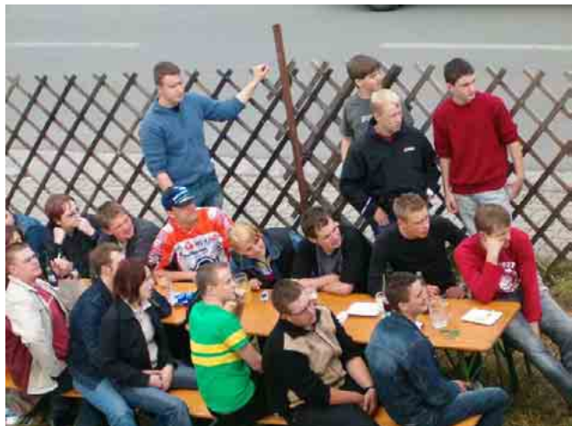
16.05.2004: Maibaumfeier in Dorf an der Pram.