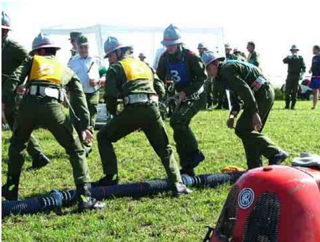
Sommer 2004: Bewerbungssaison