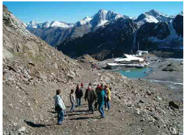
21. bis 22.08.2004: Feuerwehrausflug nach Tirol