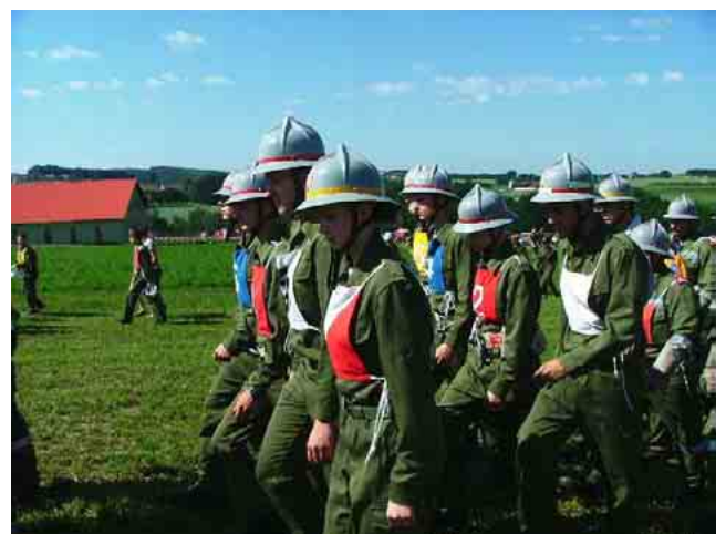
Sommer 2004: Bewerbungssaison