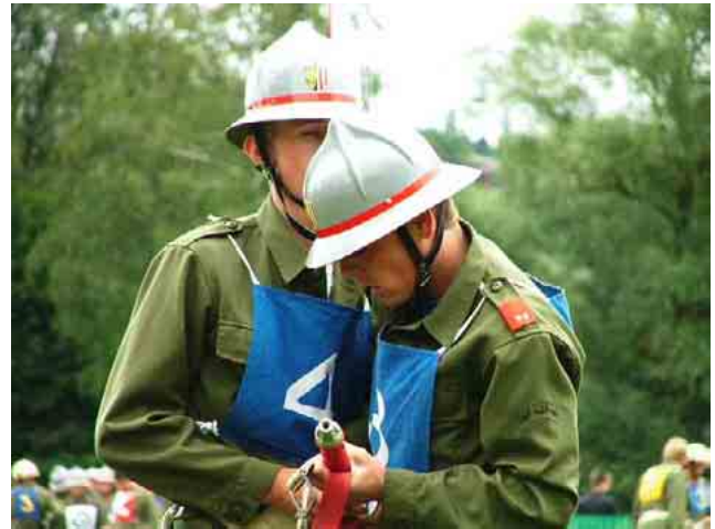
Sommer 2004: Bewerbungssaison