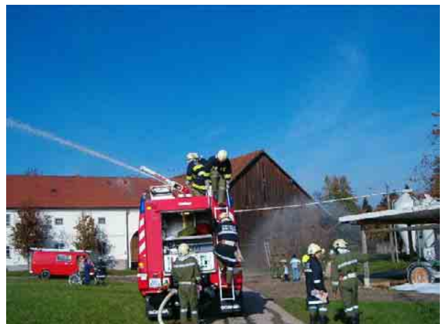
23.10.2004: Herbstübung in Breitenried