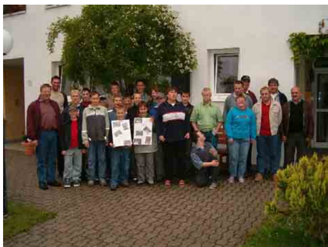
05.06.2004: Einladung ins Piusheim in Peuerbach