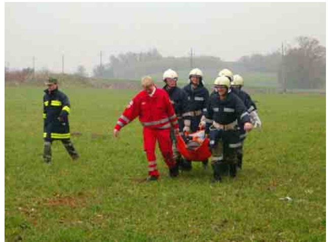
30.10.2004: Herbstübung in Pimingsdorf